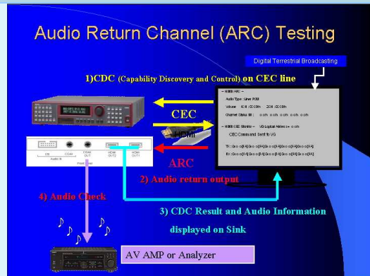
ARC 測試功能示意圖，測試結果直接顯示在 TV