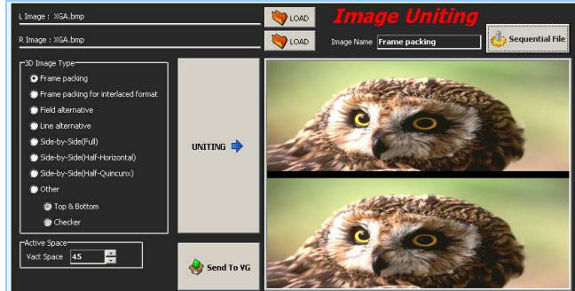
HDMI 3D Pattern BMP 圖檔專用編輯軟體 – 格式轉換 此處範例為 Fram Packing 的格式